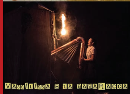
VASSILISSA E LA BABARACCA